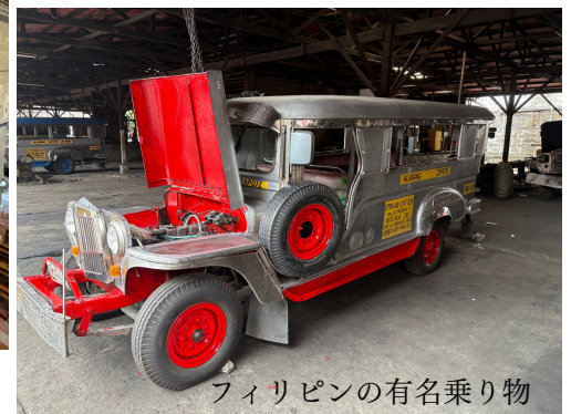
フィリピンの有名乗り物 ジブニー