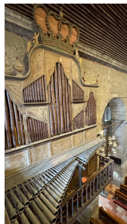
竹でできている バンブーオルガン

3年生の社会科見学で、「ラスピニャス教会」と「サラオジブニー工場」に行きました！